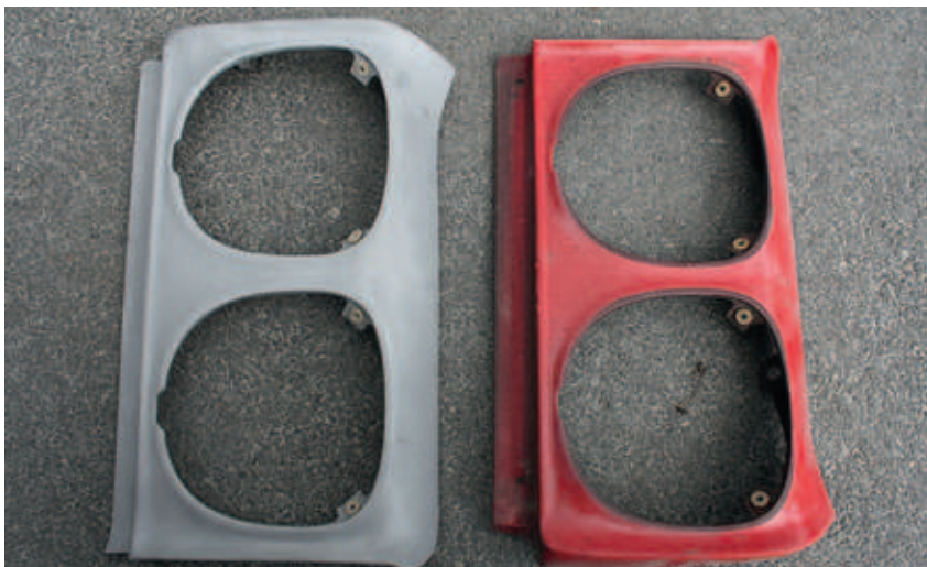
Onderdeel van een oldtimer (Chevrolet Chevelle 1970) waar de koplampen in verwerkt zitten

Naast de geschikte apparatuur voor o.a. het behandelen van prestigieuze oldtimers heeft Phibo Industries ook microstralers voor het behandelen van juwelen en kunstobjecten. Met onze microblasters kunnen dergelijke kleine en delicate oppervlakken o.a. matteren, ontbramen, polijsten, reinigen en satineren. Daarnaast kunnen met deze toestellen ook harde materialen zoals glas en staal doorboord worden. De kunstliefhebbers onder u kunnen met de Phibo microstralers zeer delicate kunstobjecten gecontroleerd gaan restaureren. Of het nu gaat om grote voorwerpen of kleine delicate objecten, bij Phibo Industries vindt men de geschikte straalapparatuur.