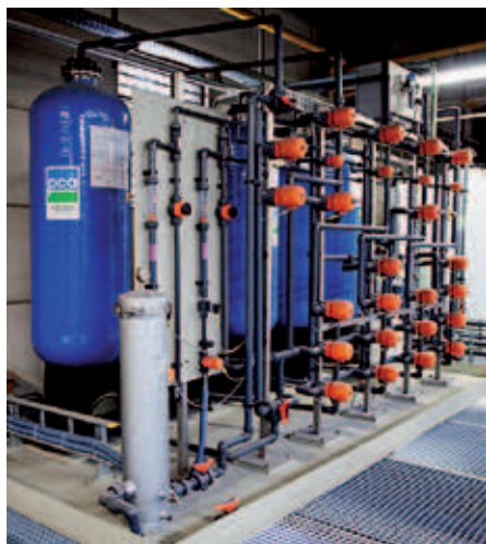
Foto 1: Via een gesloten kringloop wordt demiwater continue hergebruikt en is er dus geen verlies.

PCA is specialist op het gebied van afvalwaterzuivering, proceswaterbehandeling, luchtzuivering en bijhorende automatisering. Het is één van de twee zusterbedrijven die onder Axon Group functioneren. Het andere bedrijf is Almeco. Deze is gespecialiseerd in ventilatoren, droogsystemen en koeltorens. PCA heeft al jaren ervaring in de oppervlaktebehandelende industrie en wil zijn ervaring delen over duurzame zuiveringstechnieken van afvalwater.