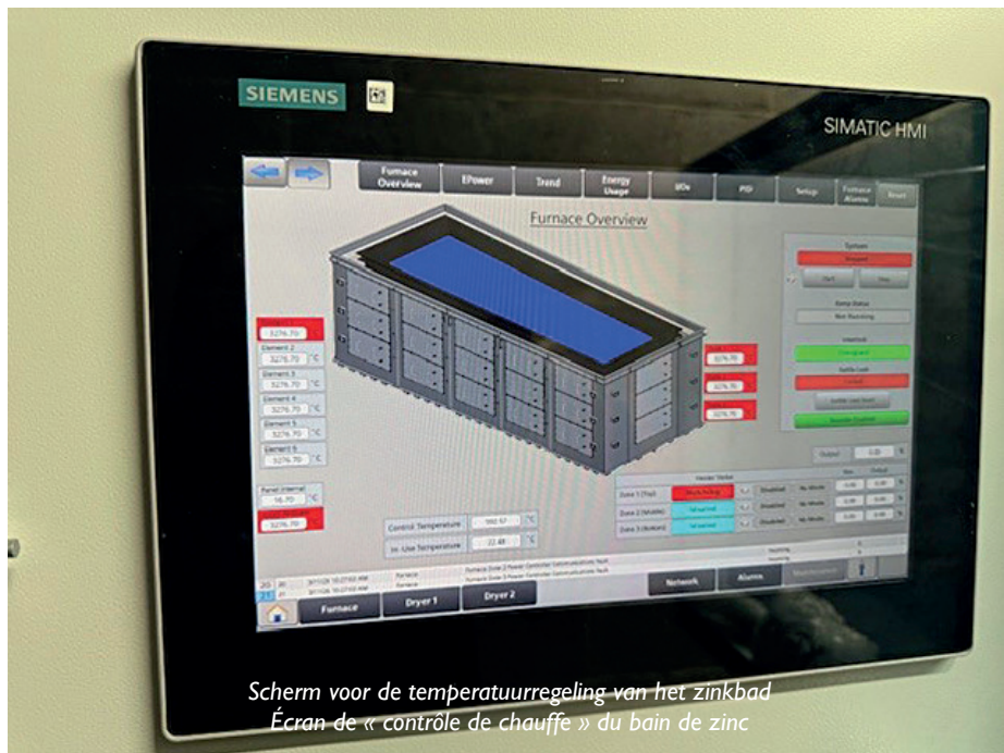
Scherm voor de temperatuurregeling van het zinkbad Écran de « contrôle de chauffe » du bain de zinc

De chemische behandelingsinstallatie bestaat uit monobloc polyester tanks, die een maximale dichtheid garanderen en het risico op lekken vrijwel uitsluiten. Hierdoor worden potentieel schadelijke stoffen op-