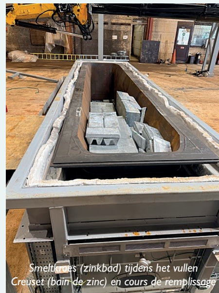
Smeltkroes (zinkbad) tijdens het vullen Creuset (bain de zinc) en cours de remplissage

mai 2026. En attendant, toutes les prestations sont prises en charge par la maison mère, via une navette gratuite, afin d'assurer une parfaite continuité de service à la clientèle.