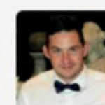
Vincent Peters VCoat