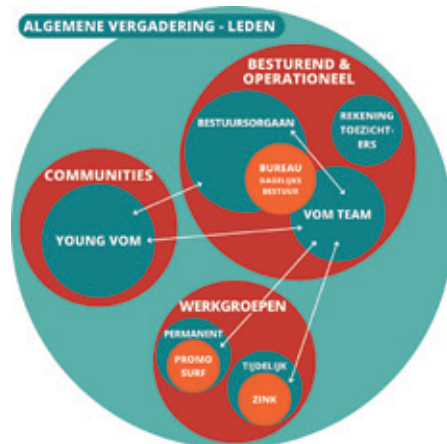
▲ Het onderwerp governance houdt iedereen bezig!

Dit diagram toont de organisatiestructuur van VOM