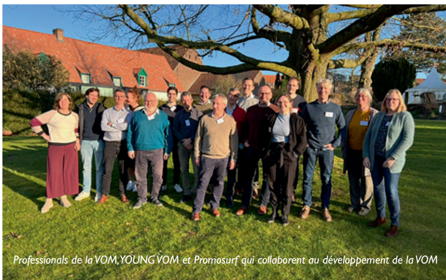
Professionals de la VOM, YOUNG VOM et Promosurf qui collaborent au développement de la VOM

L'une de nos principales priorités est d'amener nos membres à travailler activement ensemble pour défendre l'intérêt collectif de notre profession. Pas moins de 17 membres de la VOM (Almaplast, Axalta, Betafence, Chemetall, D-Coat, FMB, Galvacoat-steelcoat, Infrabel, Hatwee, MFI, PPG, Ral, Scicon Worldwide, Van Gils Coating Groep, Van Poppel Consultancy, Van Os-Duracoat et ZINQ) ont collaboré à la rédaction de la nouvelle directive pratique Peintures poudres & liquides sur supports galvanisés, paru en septembre 2021.