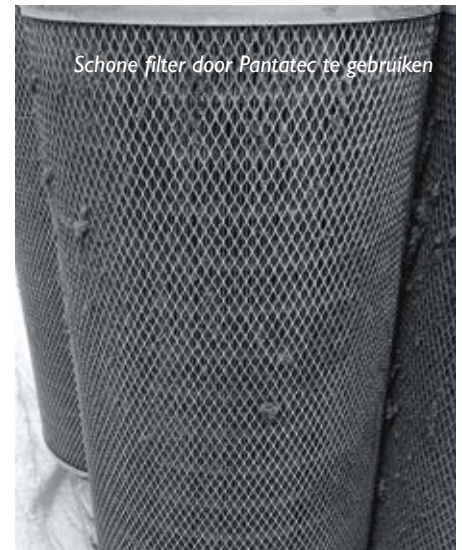
Schone filter door Pantatec te gebruiken

Om een optimaal straalproces te realiseren heeft fabrikant Pantatec ook een doseerapparaat ontwikkeld, de Injecto. Hiermee wordt Ultimate automatisch toegevoegd aan het straalmiddel. De Injecto is verbonden met de aansturing van de straalinstallatie, waardoor Ultimate alleen wordt toegevoegd als de installatie actief is. Met een bedieningspaneel wordt de gewenste hoeveelheid Ultimate ingesteld. Het systeem signaleert tijdig dat de voorraadtank moet worden bijgevuld. Dit kan handmatig of automatisch met een aanzuigsysteem.