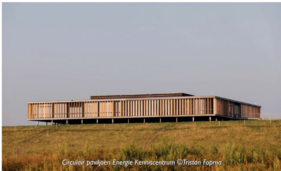
Circulair paviljoen Energie Kenniscentrum

Zinkinfo Benelux behartigt als brancheorganisatie de belangen van de thermische verzinkers in de Benelux. "Al meer dan 70 jaar houden we ons bezig met het promoten van thermisch verzinken", zegt Boender. "De conserveringsmethode voor staal werd al in 1742 op laboratoriumschaal ontdekt door de Fransman Malouin, maar pas honderd jaar later tijdens de industriële revolutie op grote schaal toegepast. Destijds werden vooral de kleine voorwerpen verzinkt, die dagelijks op de boerderij gebruikt werden, zoals emmers en teilen. Tegenwoordig zijn die van (gerecycled) plastic en worden juist de stalen balken van de grote stallen verzinkt, om maar eens in de agrarische sector te