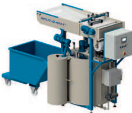
▲ Compacte Split-O-Mat® SOM 900P afvalwaterzuiveringsinstallatie met een capaciteit van 900 liter.

De compacte installaties zijn ontworpen voor de chemisch-fysische zuivering van