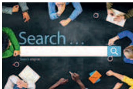
Figuur 4: High-Tech toegangspoort

Wat dit vandaag al voor bedrijven in en rond België - waaronder deze van de VOM - en op termijn voor alle bedrijven uit de desbetreffende hoogtechnologische sectoren in Europa betekent, omvat twee luiken. Ten eerste biedt i.Revitalise op een eenvoudige manier toegang tot een waaier aan hoogtechnologische machines, apparatuur en expertise (Figuur 3). Bedrijven en organisaties die bezig zijn met innovatie en R&D krijgen een toegangspoort tot "High-Tech" middelen, zonder enkele 100k€ of zelfs enkele Mio€ te moeten investeren (Figuur 4).