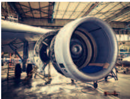
Figuur 1: één van doelsectoren is onderhoud en revisie

In een studie van PwC uit 2016 wordt in kaart gebracht hoe in 2015 de deeleconomie in Europa goed was voor 28 miljard euro aan transacties (Figuur 2). Tegen 2025 groeit de economische waarde aan transacties naar 580 miljard euro in Europa. PwC haalt aan dat Europa een draaischijf kan worden voor de deeleconomie. I.Revitalise draagt bij aan het behalen van een deel van dit economische potentieel voor Europa in drie hoogtechnologische sectoren: de maakindustrie, de onderhouds- en revisiesector (Figuur 1) en de onderzoek- en ontwikkelingsinstituten.