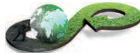
Figuur 5: hergebruik van bestaande machines, operatoren en know-how

staande machines, operatoren en know-how, Figuur 5).