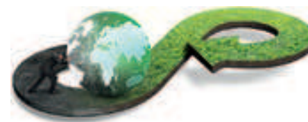
Figure 5: réutilisation de machines, opérateurs et savoir-faire existants

Deuxièmement, c'est un renforcement du réseau industriel européen. Partager de la capacité génère des revenus supplémentaires, et en plus augmente la résistance de ces entreprises. Les 5 milliards d'euros c'est le potentiel de ces revenus supplémentaires de façon durable (réutilisation de machines, opérateurs et savoir-faire existants, Figure 5).