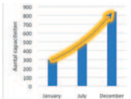
Figuur 3: groei van de i.Revitalise capaciteiten in aanbod (2018)

Ten tweede is er een versterking van het Europese industriële weefsel. Delen van capaciteit genereert extra omzet, maar zorgt ook voor meer weerbaarheid voor bedrijven. Deze 5 miljard euro is het potentieel aan extra omzet voor deze bedrijven, op een duurzame manier (hergebruik van be-